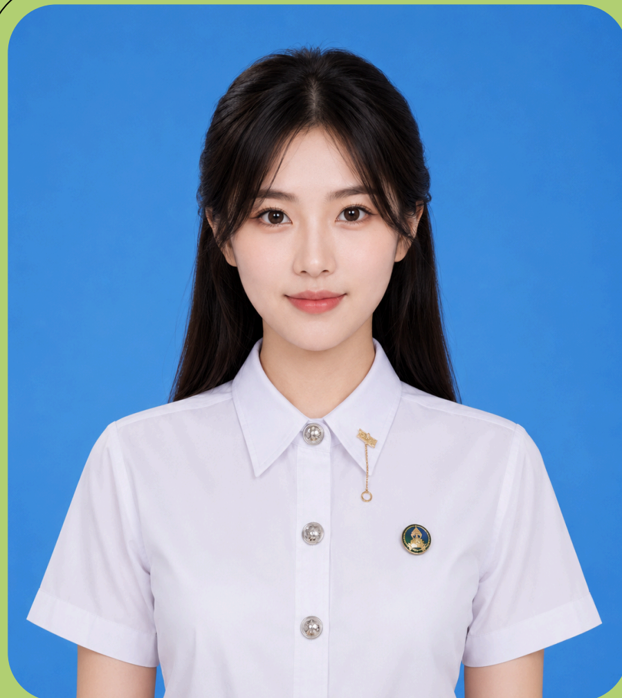
รูปหน้าตรง ชุดนักศึกษา เรียบร้อย